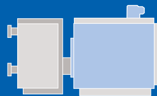
Чугунные отопительные котлы Buderus могут быть оборудованы конденсационными экономайзерами