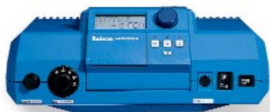
Система управления Logamatic 2000

Если вы хоть раз попробуете регулировать отопление с помощью системы обслуживания Logamatic 2000, Вы поймете, что мы понимаем под «простотой обслуживания». Вам не нужно изучать инструкцию по эксплуатации,